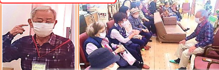
会長ご挨拶と皆さまと歓談