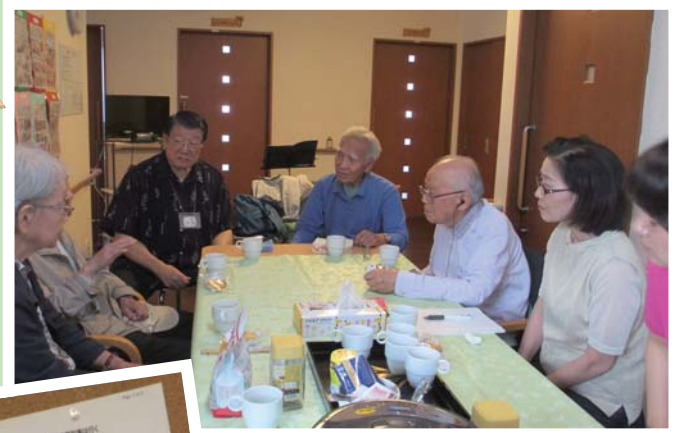
介護の先輩の話に興味津々