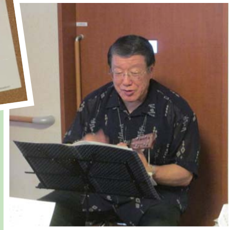
いつも上手なウクレレとトークで 皆を引き込みます。