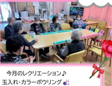
今月のレクリエーション♪ 玉入れ・カラーボウリング🎳