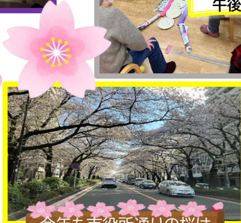
今年も市役所通りの桜は 綺麗でしたね♥♥♥ 何回もドライブいきました🌸