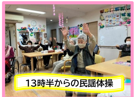
13時半からの民謡体操