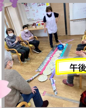
午後のレク! 何点入るかな~🌸