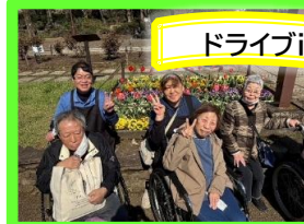
ドライブin相模原北公園