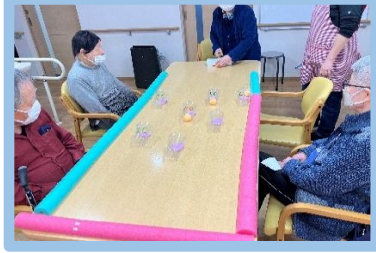
ピンポン玉コップに 何点入るかなゲーム