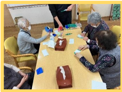
皆さまでおりがみ♪ 何ができるかな～♪