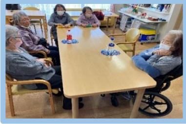
ペットボトルを落とさないように クルクルゲーム

毎日職員が色々なレクを考え、体を動かしたり脳トレを行っていますので一部を紹介いたします👇👇👇