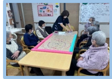
ペットボトルのキャップ カーリング