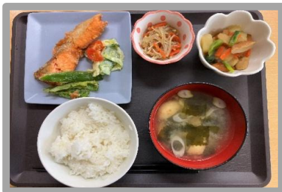
🍴とある日の昼食メニュー🍴 ・ご飯・具たくさんお味噌汁 ・鮭のムニエル・エノキのきんぴら ・大根の煮物