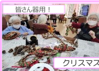
クリスマス リース作り