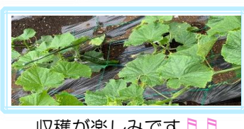
収穫が楽しみです🎵