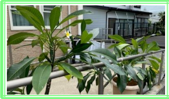
プルメリア🌸が咲いています