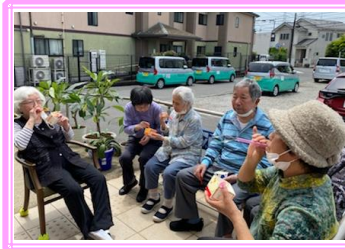
< レク風景 >