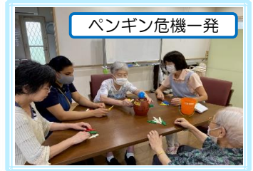
ペンギン危機一発