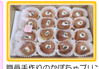
職員手作りのかぼちゃプリン