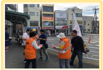
希望が丘駅前にて「赤い羽根共同募金」に参加しました♡