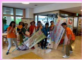
①ケアプラザを出発 行ってきま〜す(*^▽^*)ノ