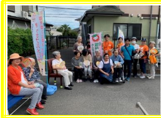
②中継地点・プルメリア 利用者様と一緒に記念撮影♪