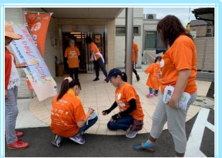
③次へとタスキをつなぎます 「あとをお願いしま〜す！」