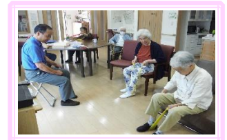
身体を伸ばしながら気持ちよく運動しています p(^-^)/ 毎日のレクとして少しずつ行っています♪