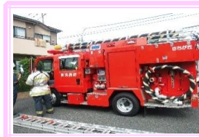
< 消防訓練 > (プルメリア・ずうずう合同)