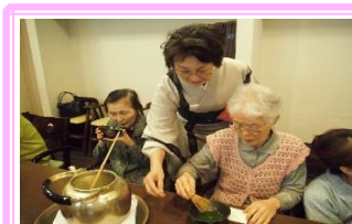
抹茶を点てました♪