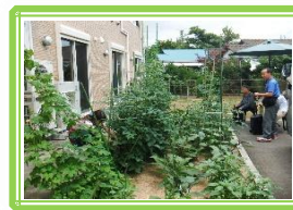
< プル畑 > すくすくと成長しています♪