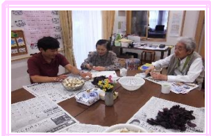
< らっきょう漬 >