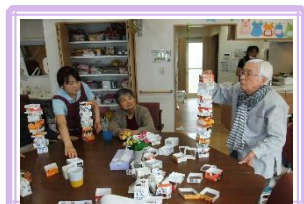
< レク > 牛乳パック (大小) 積み上げ