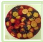
色が付いてきました♪