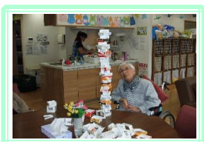
今日はどこまで積み上げられるかな…♪