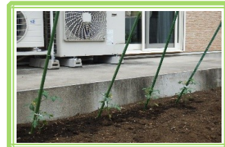
プチトマトを植えました。収穫が楽しみです♪