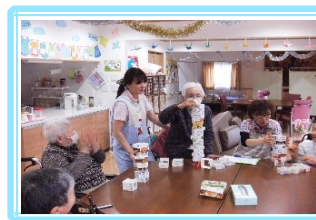
「みんな、何段 積み上げられるかな~! ?」