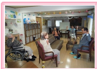
身体を伸ばしましょう~♪