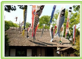
たくさんの鯉のぼりが気持ちよさそうに泳いでます♪