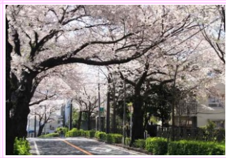
お花のトンネルがとってもきれいでした♪ (染井吉野)