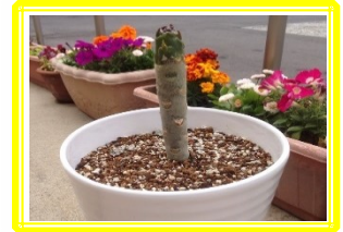
挿し木をしました🌲 根付きますように🌟