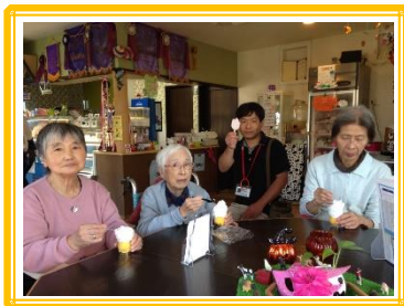
冷たくておいしいね♡♡♡