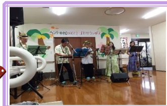
ほかほかデイサービスにて ハワイアンジャズバンド♪♪♪