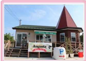
オーガスタミルクファーム