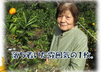
落ち着いた霧田気の1枚。