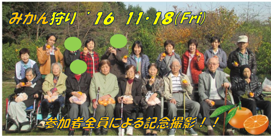
参加者全員による記念撮影！！