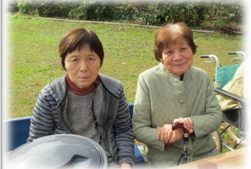
みかん狩りが始まる前のオフショット