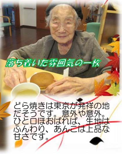
落ち着いた雰囲気一枚

どら焼きは東京が発祥の地 だそうです。意外や意外。 ひと口ほおばれば、生地は ふんわり、あんこは上品な 甘さです。