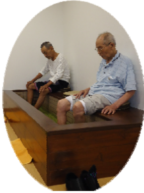
足湯の様子 一番人気は木酢湯