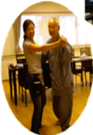
楽しくダンスも踊ります