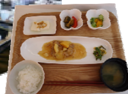
機能訓練 キャロット体操です 食事の様子