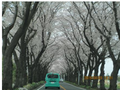
海軍道路は今年も花見渋滞していましたね