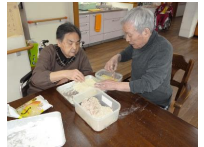
写真を見ているとお腹が空いてきますね