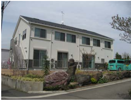
瀬谷柏尾道路沿いです。