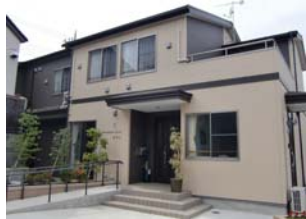
小規模多機能 ロマン

私はこれまで在宅ヘルパー、デイケア相談員を経験し、3年がかりで昨年念願のケアマネジャーを取得することが出来ました。介護に携わり10年になります。