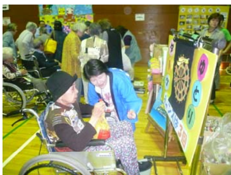
ダーツでのを狙います。真剣！

参加者全員がケガする事なく無事終える事が出来ました事を協力下さった皆様に感謝いたします。