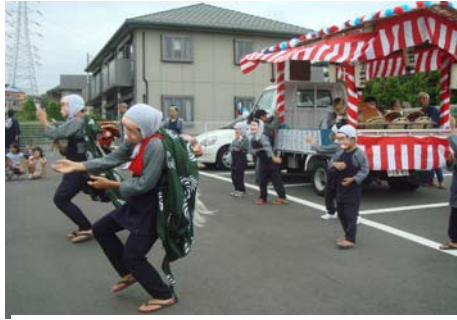
「こんなに盛大なの？」

この運びは一昨日の「運営推進会議」での出来事・・・。 地域の委員の方から、「もし良かったら明後日、「おみこし」があるので、