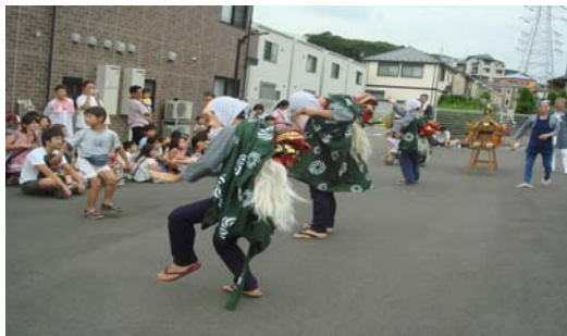
立ち見も出る大盛況

グループホームれんげは、お隣りにグループホームすみれもあり、お祭りとなるととてもにぎやかです。