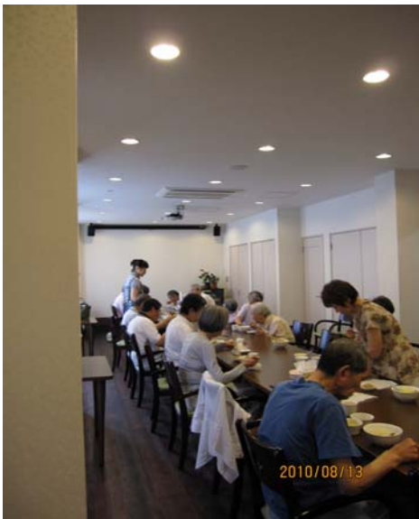
なでこ 8月13日 食事会