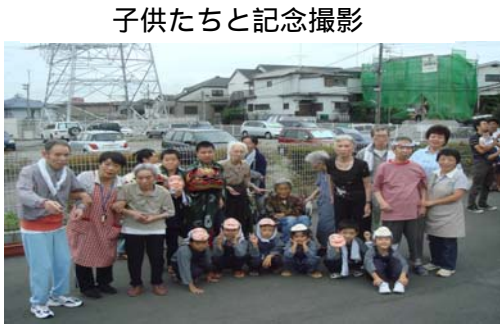
子供たちと記念撮影