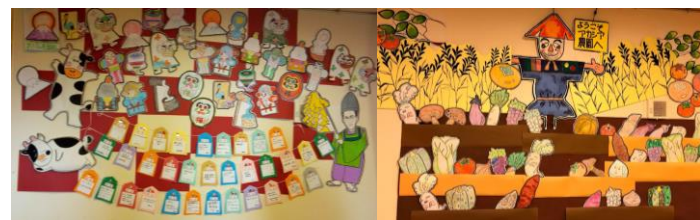
お正月の塗り絵壁画

様々な活動の中で塗り絵があります。アカシアの施設内1階には大きな壁があり、そこで四季折々の塗り絵を通じて利用者様と共に大壁画（縦148cm×横240cm）を制作しています。塗り絵を通して季節感を感じ、協力関係を築くことに意義があり、心身の健康と幸福感を感じてもらえることを望んでいます。