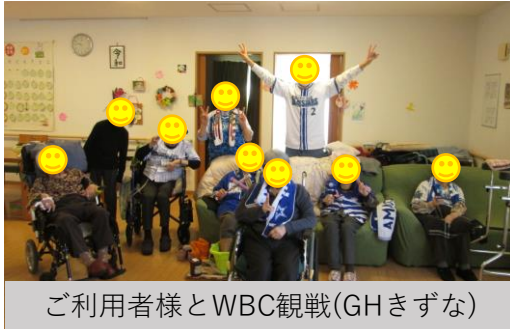
ご利用者様とWBC観戦(GHきずな)