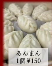
あんまん 1個 ¥150