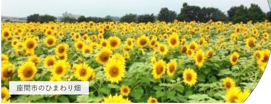
座間市のひまわり畑